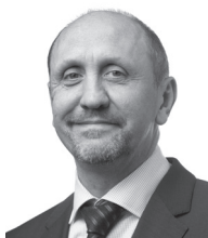
Johan VANDE LANOTTE

Vice-Eerste Minister en Minister van Economie, Consumenten en Noordzee