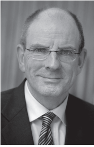
Prof. dr. KOËN GEENS

Gewoon hoogleraar Katholieke Universiteit Leuven Voorzitter van de Hoge Raad voor de Economische Beroepen van 1992 tot 2000